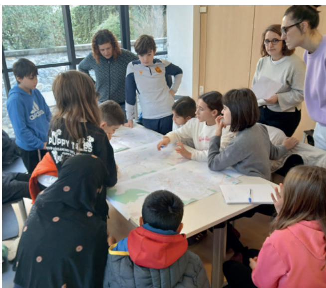
LHko ikasleen Foroa

Urtarrilak 15ean Floreaga ikastetxeko eta Xabier Munibe ikastolako ikasle ordezkariak elkartu gara, bi ikastetxeen emaitzak bateratzeko. Izan ere, bide zati handi bat elkarrekin egin dezakegu!